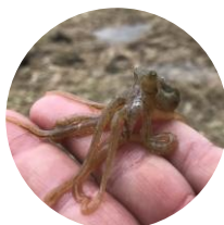
ウデナガカクレダコ