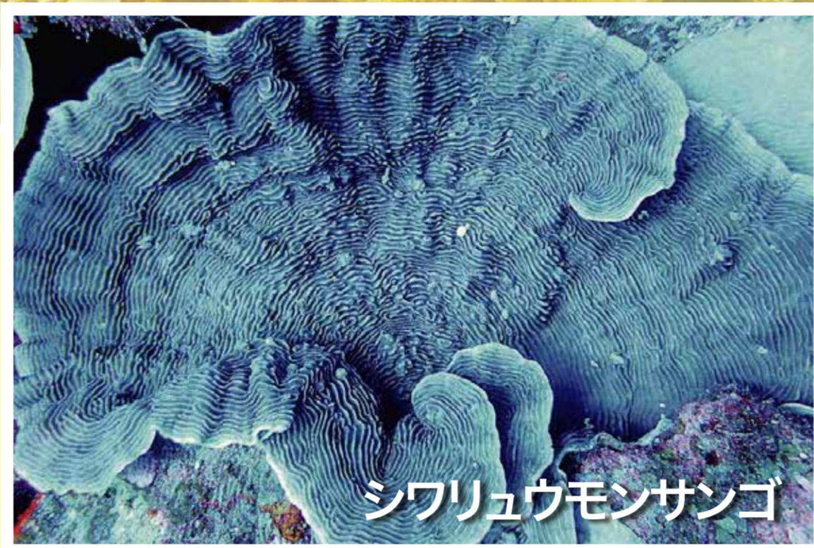
シワリュウモンサンゴ