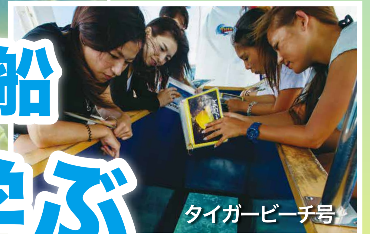
タイガービーチ号