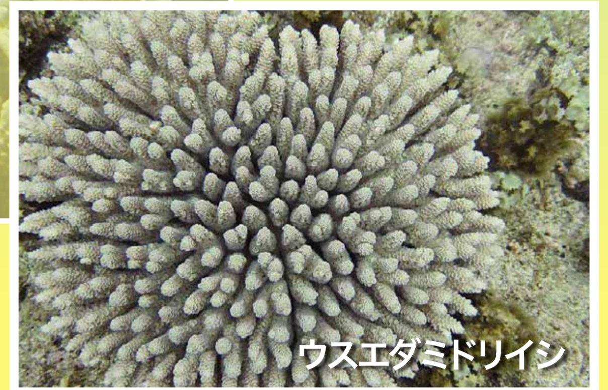
ウスエダミドリイン