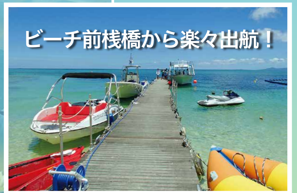
ビーチ前桟橋から楽々出航！