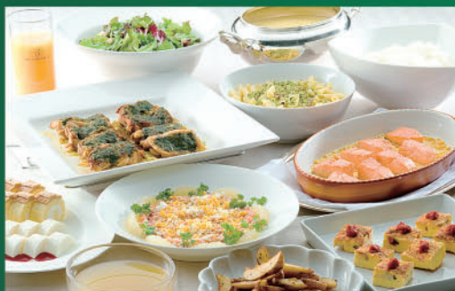
【夕食】料理イメージ