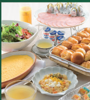
【朝食】料理イメージ

ホテルのシェフが季節の食材を使い腕を振るった料理を、様々なバリエーションでご用意いたします。